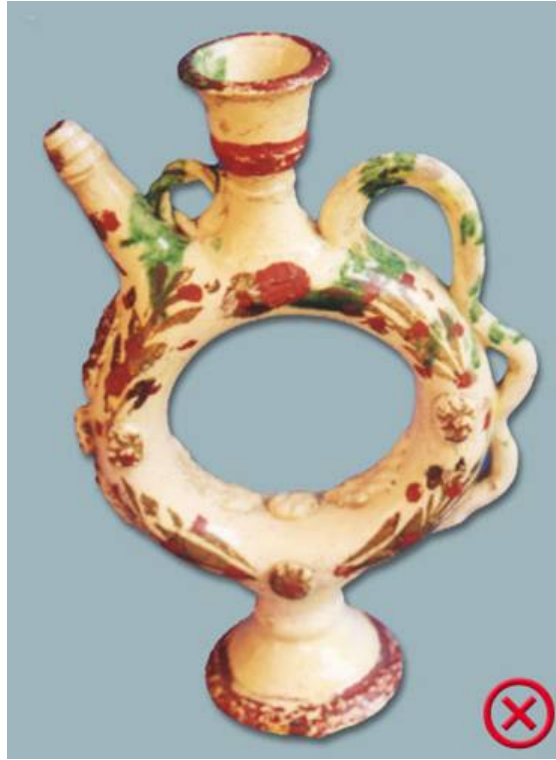
Çanakkale üretimi simit testi