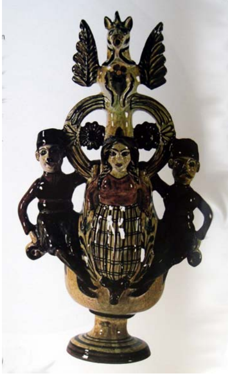
Ayasos-Lesbos, Hacıyannis atelyesi yapımı at başlı testi