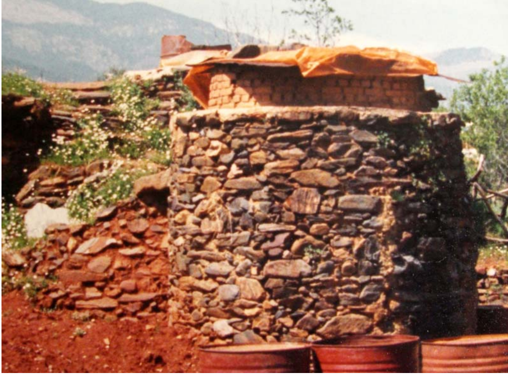
Aydın Karacasu’da geleneksel çömlekçi fırını