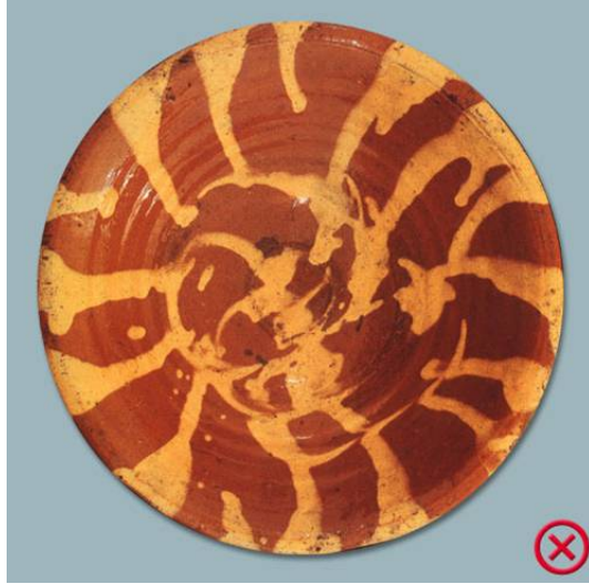
Rodos adası üretimi Çanakkale tipi astar akıtmalı tabak