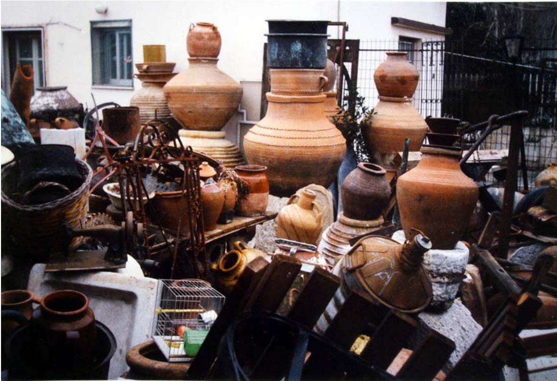
Atina , Marussi'de 19 yy.Batı Anadolu yapımı küpler. Foto: Sevim Çizer, 1993

Bugün Çanakkale'de "eski Çanakkale seramiklerinin üretimi yapılmamaktadır. Bu seramikler, bu nedenle artık koleksiyonlarda yer almaktadır. Oysa pek çok benzer biçim ve bezemeli seramik halen Ege Adaları'nda üretilmektedir.