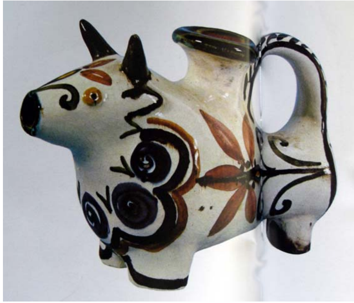
Ayasos-Lesbos, Hacıyannis atelyesi yapımı " Kanata" adı verilen kap, Foto kaynak: Betty Psaropoulou, Last Potters of the East Aegean