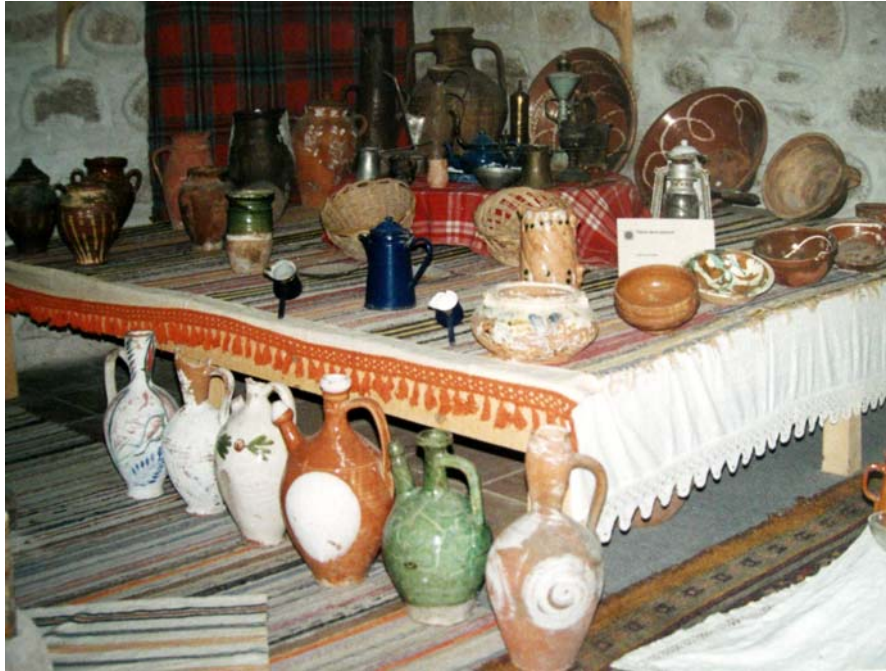
Lesbos, Belediye Etnografya Müzesi, seramik eserler koleksiyonu, Foto: Candan Güngör, 1998