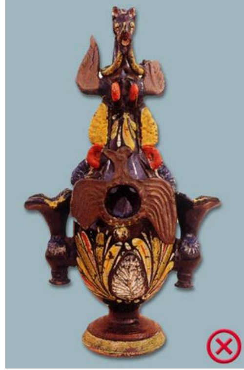
Çanakkale atelyeleri yapımı at başlı testi