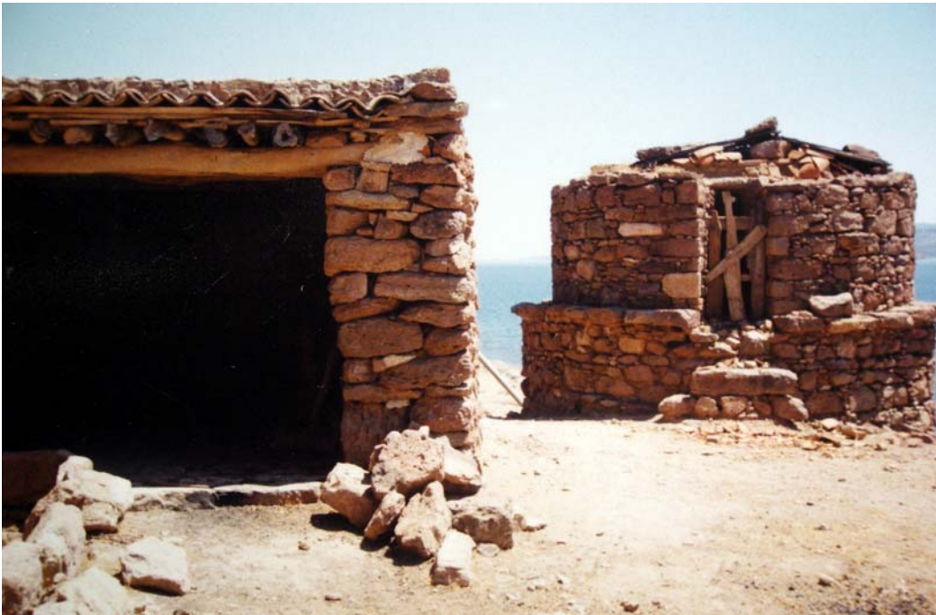
Lesbos- Aya Stefanos'da Kouvdıs ailesi fırını “Anadolu tipi fırın”, Foto: Sevim Çizer 1998

Son yıllarda çömlekçiler tarafından da yaygın biçimde kullanılmaya başlayan elektrikli fırınların yanı sıra halen kullanılmaya devam eden geleneksel odunlu fırınlar, örnek olarak ele aldığımız bu üç adada da Anadolu'daki benzerleri gibidir. Kare veya daire planlı gövdeler genellikle içten silindirikdir. İki katlıdır. Katlar: a) ateşlik, b) işlerin doldurulduğu odacık. Bu iki bölümü birbirinden delikli bir taban ayırır. Lesvos'da bu tip fırınlar “Türk tipi” olarak adlandırılmaktadır. Üstten çekişli bu fırınların bedeni taştan, çatısı ise ateş tuğlasından örme tonozlu veya kubbelidir. Buraya “tavani” adı verilir. İşlerin yerleştirildiği odacığa ise “kazani” denir. Bu tip fırınlara Samos ve Xios adalarında da rastlanır.