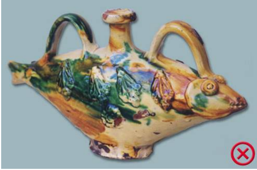
20. yüzyıl başı Çanakkale üretimi, balık biçimli “ akuamanil” adı verilen kap, Foto kaynak: Suna-İnan Kıraç Çanakkale Seramikleri Koleksiyonu Kataloğu