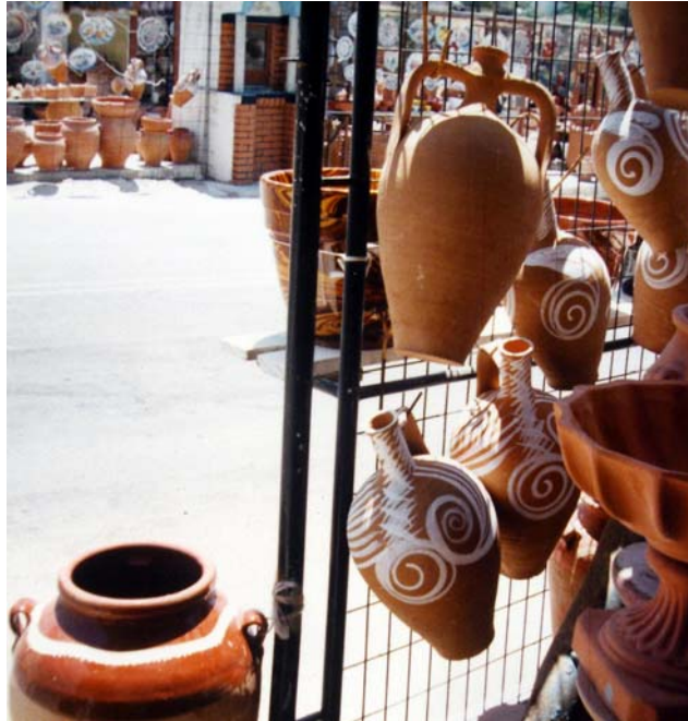
Armolia-Xios adası bezemeli testileri, Foto: Sevim Çizer,1993