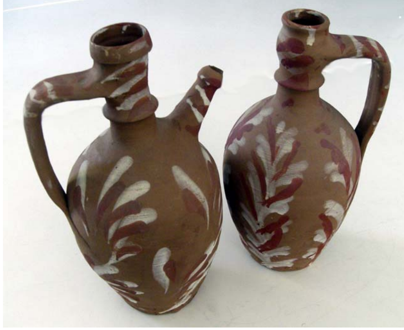
Çanakkale- Akköy bezemeli testileri, D.E.Ü. Seramik Bölümü Koleksiyonu, Foto: Sevim Çizer, 2002

Xios adasındaki Armolia köyü eski seramik üretim merkezidir. 1915'de bu köyde yirmi beş adet fırın bulunduğu belirtilmektedir(5). Bugün ise sadece küçük anı eşyası üreten bir atölye ile testi, güveç vb. kaplar yapan bir diğer atölye bulunmaktadır. Sırsız olarak üretilmekte olan bu kapların üzerine Çanakkale-Akköy ya da Aydın- Karacasu da yapılanların benzeri beyaz kilden serbest fırça bazen da parmakla doğaçlama desenler yapılmaktadır.