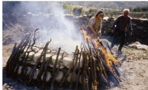
Resim 9: Pişirim- İlk Aşama