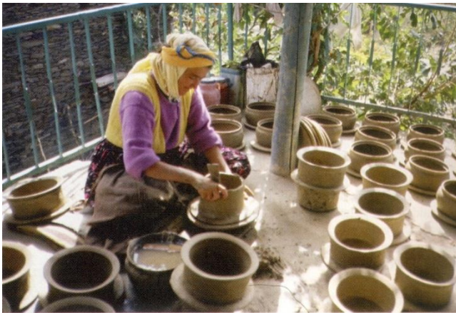
Resim 5: Şekillendirme- Yükseltme

Biçimlendirme sırasında kullanılan alet sayısı neredeyse yok denecek kadar azdır. Kısa, bir ok görünümünde, ahşaptan yapılmış el aletinden yararlanılmaktadır. Küçük bir bez parçası da yüzey düzeltme işlemi için kullanılmaktadır.