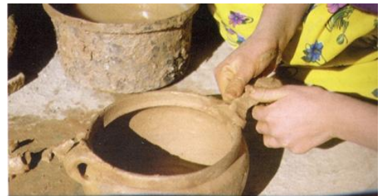
Resim 6: Şekillendirme- Kulp