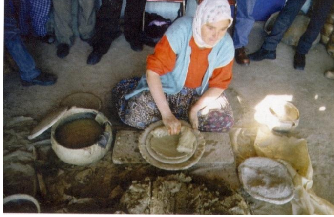
Resim 4: Şekillendirme- Gövde

İlkel çömlekçiliğin söz konusu olduğu tüm köylerde olduğu gibi, kullanılacak kilin eve getirilmesi ve buralarda depolanması erkeklerin işidir. Ancak biçimlendirme bütünüyle kadınlara aittir. "Biçimlendirme, "Dönek" denen ve mil olmamasına karşın altı dışbükey olduğundan döndürülebilen, kilden bir tabak üzerine oturtulmuş ve gene kilden yapılmış "kalıp" denen bir altlık üzerinde "kıyı" adi verilen bantlarla, bant usulü yapılmaktadır. Kıyıların hazırlanmasına "kıyı yuvarlama", hazırlanan kıyıların üst üste konarak pekiştirilmesi işlemine de "süvmek" denir. 3