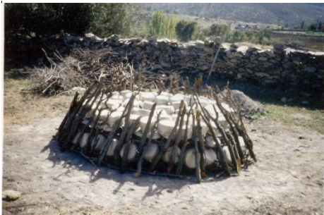
Resim 8: Pişirim- İstifleme