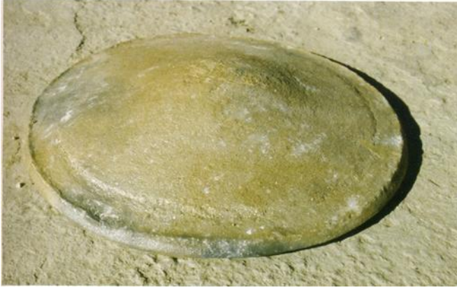
Resim 2: Dönek

"Gökeyüp 'teki kapkacaklar "sakızlı toprak" adi verilen normal kırmızı kilin, "mengele" dedikleri mika K(Mg,Fe)_3 ((OH.F)(AlSi)O görünümünde bir toprakla 2/1 oranında karıştırılmasıyla yapılmaktadır. Bu karışım, çok kendine özgü nitelikler taşımaktadır; öyle ki, dünyanın neresine giderse gitsin Gökeyüp toprağı ayırt edilebilir." 1