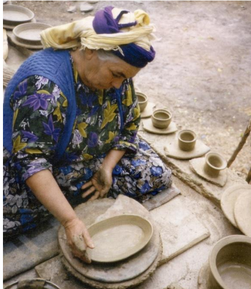
Resim 7: Şekillendirme- Kayık Tabak

"Gövdelerin biçimlendirilmesi bitince güveçler güneşte biraz çektirilir, sonra gene elden geçirilerek karınlama ve kulplama işlemleri yapılır. Kalıbı kendiliğinden bırakıncaya dek kuruduktan sonra güveçlerin fazlalıkları "kazıyacak" adı verilen bir teneke parçasıyla kazınır. Bu işleme "kırkazımak" denir. Güneşte iyice kuruyan, onların deyimiyle "tepinen" kaplar, "kap pişeceği yer" adı verilen evin bahçesinin ya da avlusunun belirli bir yerinde, açıkta çalı çırpı ve odunla, güveçlerin üstüste dizilmesiyle rüzgârlı bir havada yakılan ateşte bir saat sureyle pişirilir. Rüzgarsız havaya rastlayan pişirime "tonuk" denir ve bu kaplar çabuk aşınır (üğünür). Rüzgârın şiddetli estiği zamanlarda yapılan pişirimde, kümenin dışında, rüzgârla daha fazla temas eden kaplar, parlar; bu olaya "şılak" adı verilir. Pişirimden sonra kaplar, sıcakken kümeden alınarak gübreye karıştırılmış samana atılır. Bu arada kabin yüzeyinde meydana gelen indirgenme olayı nedeniyle kapların rengi koyulaşır ve pırlıtlı bir görünüm alır." 4