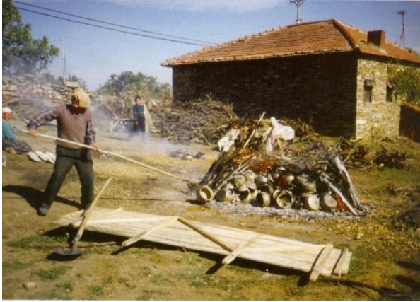
Resim 10: Pişirim- İkinci Aşama

Kuruma aşaması tamamlanıncaya kadar, üretilen her yeni kabın hemen altında bulunan kalıp parçasıyla birlikte kalması gerekmektedir. Bu nedenle, her ailenin çok sayıda kalıbı bulunur. Burada bir anlamda markalaşmayı gösteren, her ailenin kendine ait "nişanı" kalıplar üzerine kazınır; yapılan kaplar üzerinde de bu nişan kabartma olarak çıkar. Böylece her türün, hangi aile tarafından yapıldığını gösteren izi ile birlikte pazara çıkar. Genellikle satış yerlerinde kendi yöresinin adı ile değil Menemen kapları olarak satışa sunulurlar. Doğal olarak bu ürünler sadece ilgilisi tarafından bilinen kaplar olmaktadır.