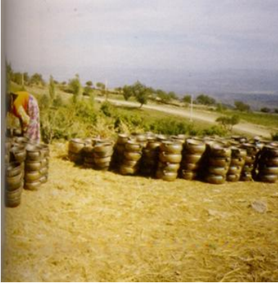
Resim 13: Pişmiş Ürünler