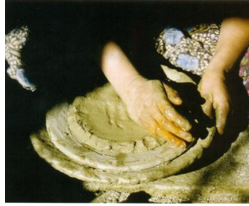
Resim 3: Şekillendirme Taban

"Doğadan aldıkları Mengele (kaya görünümlü) büyükçe bir tahtadan tokmak veya un değirmeni ile ufalanıp toz halde diğer toprakla harmanlanmaktadır. Toprağın taşınip, öğütülüp çamur haline getirilme işlemleri erkekler tarafından yapılmaktadır." 2