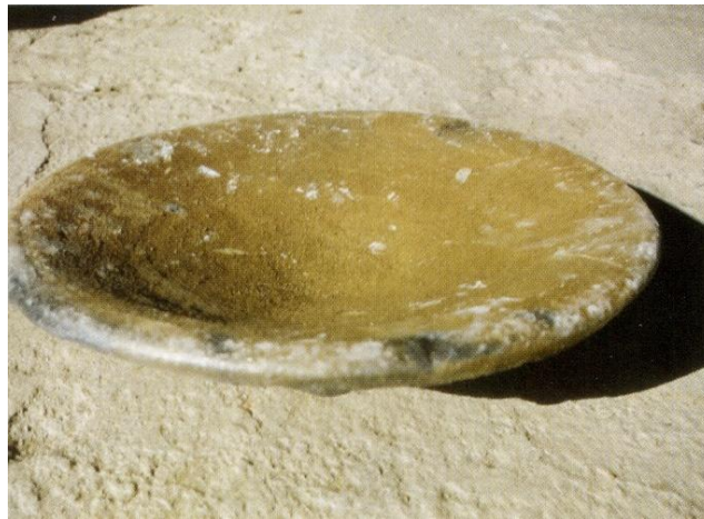
Resim 1 : Dönek

Bu çalışmada, ilkel üretim yöntemini başlangıcından beri herhangi bir değişime uğratmamış, olan ve özellikle de yaşadığımız ile yakınlığı nedeniyle Gökeyüp köyünü seçtik.