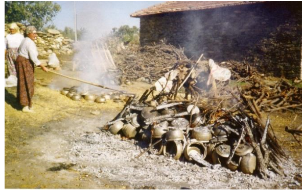
Resim 11: Pişirim- Son Aşama

Bu çalışmada asıl göstermeye çalıştığımız noktaların ilki, Gökeyüp çömleklerinin ilk seramik buluntularının çıkarıldığı Hacılar ve Çatalhöyük'teki ilk örneklerle benzerliğine dikkat çekmektir. İkincisi ise; Manisa'nın bir dağ köyünde, halen tarih öncesi dönem seramiklerinde görülen üretim özelliklerinin herhangi bir bozulmaya uğramadan devam ettiğini göstermektir.